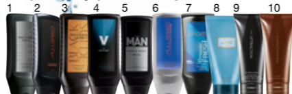
Sprchovacie gély PRE NEHO