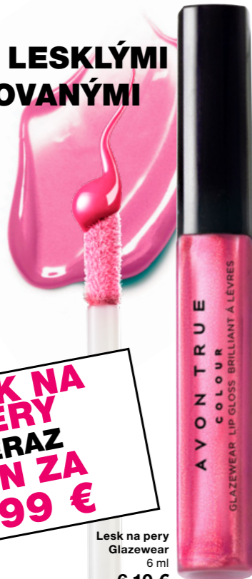
Lesk na pery Glazewear 6 ml 6,10 €

lesk na pery v sýtych farbách so žiarivým leskom a hydratačným zložením s olejom