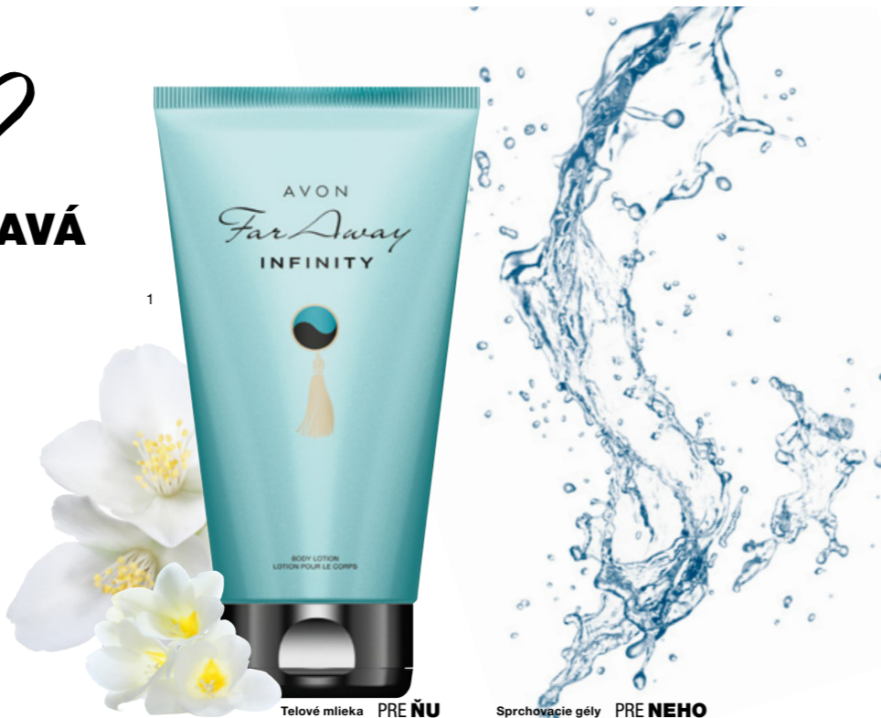
Telové mlieka PRE ŇU